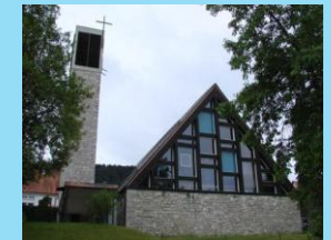
Wehingen Evangelische Christuskirche