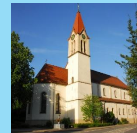
Wehingen St. Ulrich