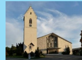
Gosheim Heilig Kreuz