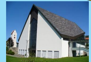
Deilingen Christi Himmelfahrt